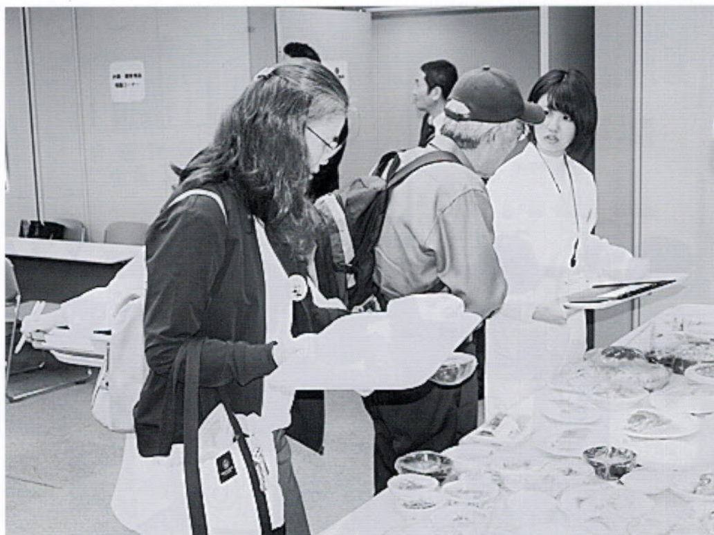
バーチャルバイキング