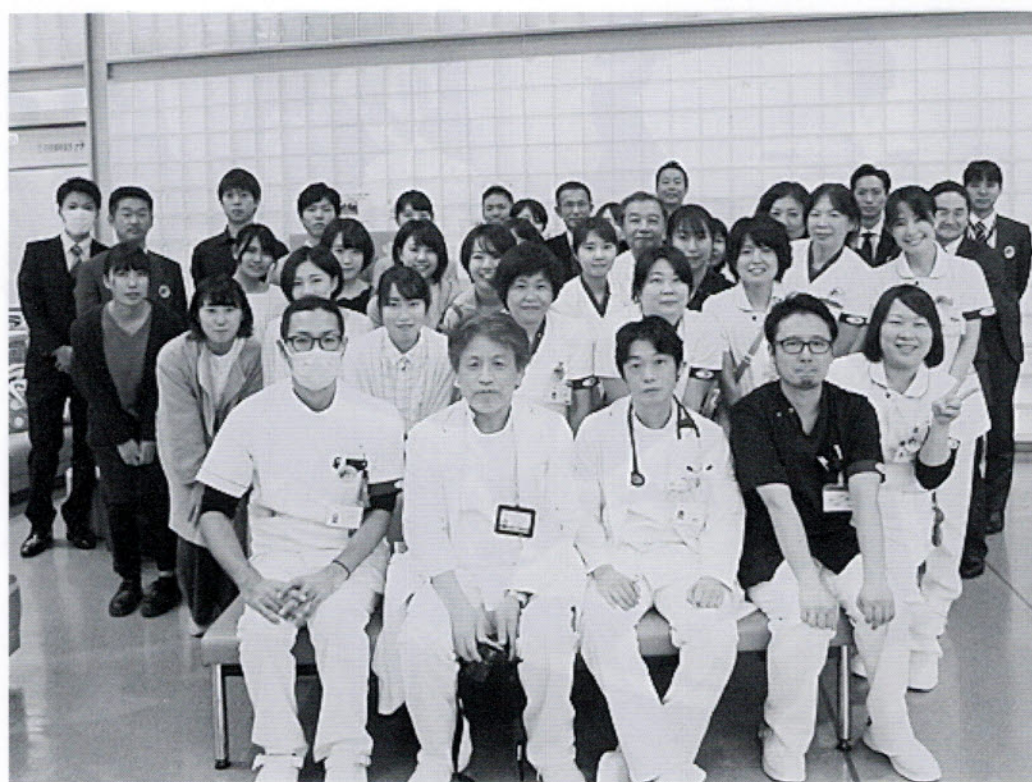
スタッフ集合写真