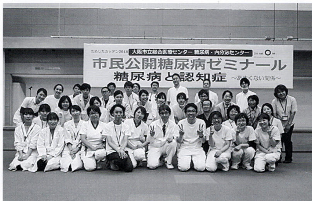
スタッフ集合写真

新設講座として実施された「ためしたカッテン2018」の糖尿病・認知症に関するセミナーの様子