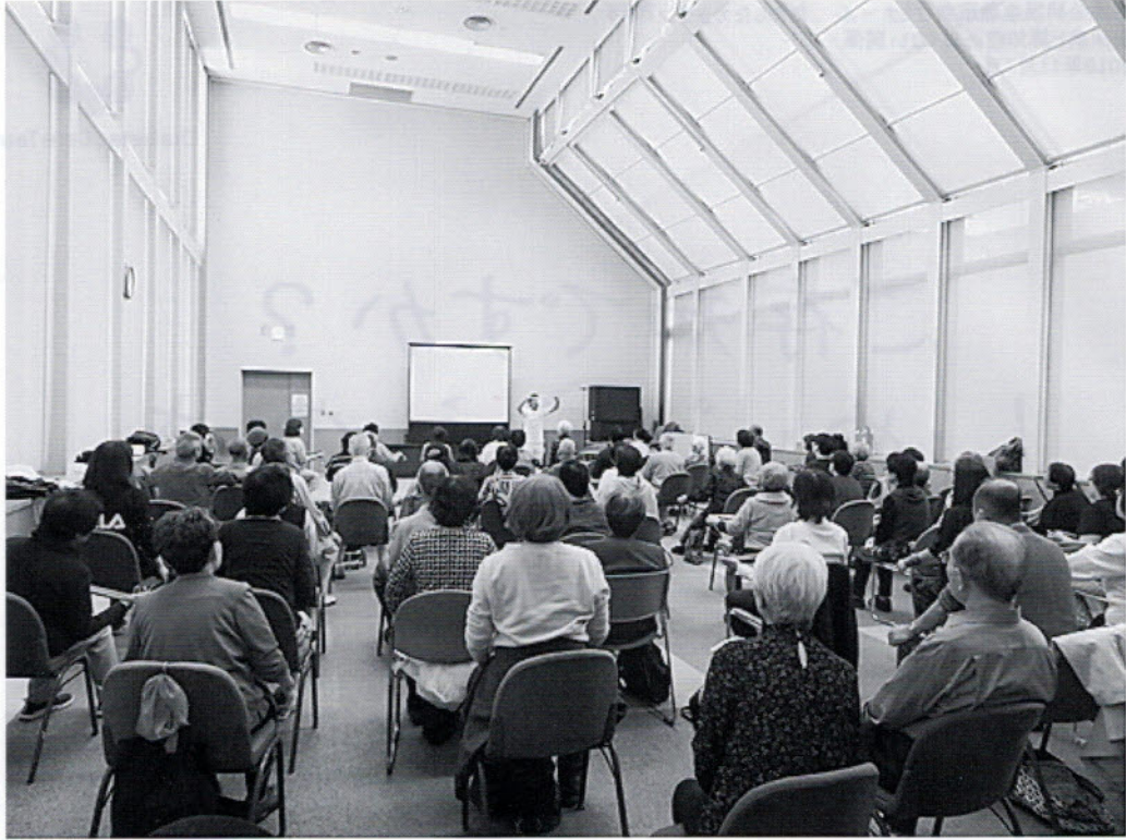
理学療法士によるセラバンドを使ったレジスタンス運動指導