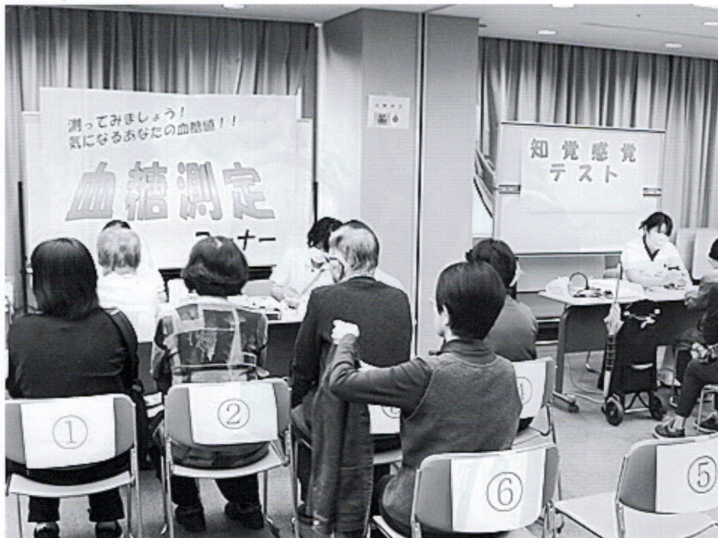
血糖測定と知覚痛覚測定