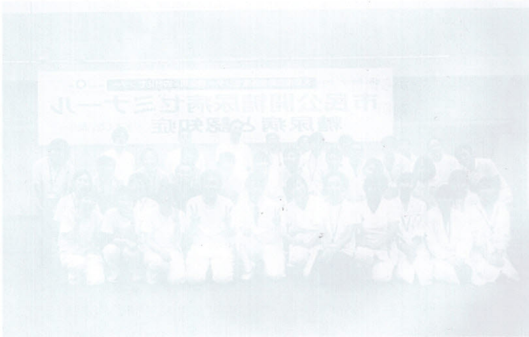
真若会館でセミナー