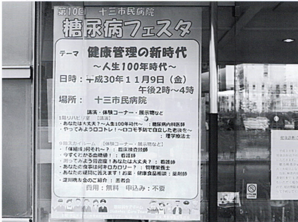
病院入口のポスター